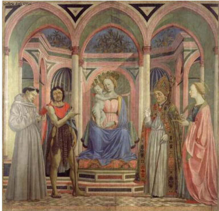
دۆمنیکۆ ڤینسیانو Domenico Veneziano